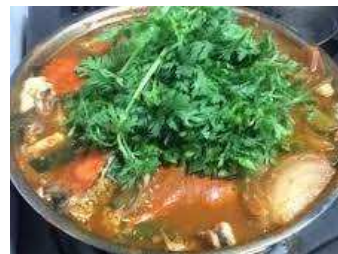
海鮮寄せ鍋(イメージ)