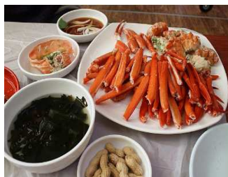
カニ料理(イメージ)