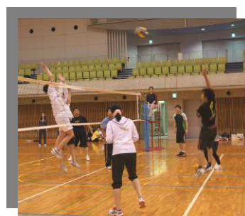
< 昨年の様子 >